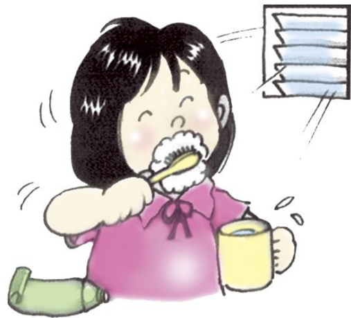
ภาพการแปรงฟัน