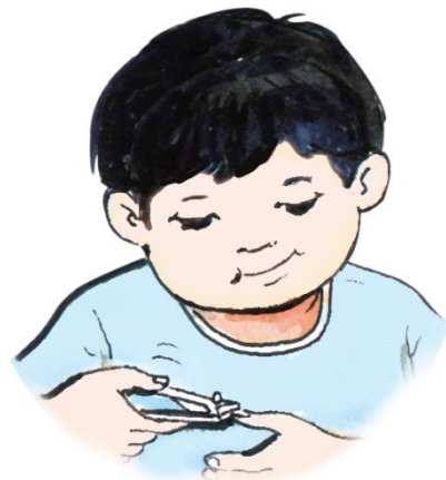
ภาพการตัดเล็บ