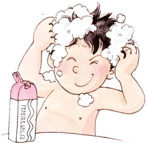
ภาพการสระผม