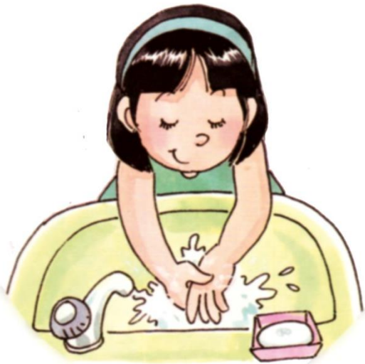
ภาพการล้างมือ